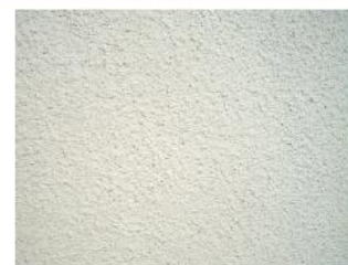
Losalin muro azúcar aplicado con pistola