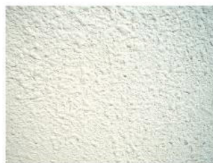
Cielo especial aplicado con pistola boquilla 8