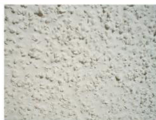
Losalin muro grueso aplicado con pistola