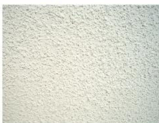
Losalin muro fino aplicado con pistola

Productos de alto tráfico, en polvo con cuarzo y en sacos de 30 kilos; especial para muros, fachadas, estacionamientos y panderetas. Se recomienda, agregar resina para su adherencia y permeabilidad dependiendo de las condiciones climáticas a que se le someta y del tráfico que exista en el lugar donde se aplique el material.